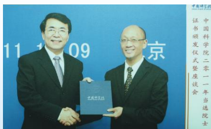
黄路生校党委书记（右一），教授，博士生导师，中国科学院院士、发展中国家科学院院士、国家杰出青年基金获得者，全国杰出专业技术人才