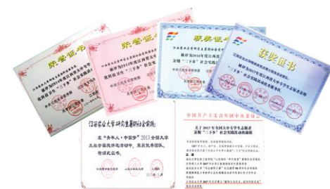
研究生暑期社会实践活动连续获得国家和省级奖励