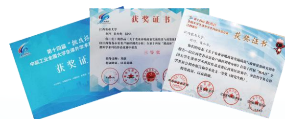
研究生在“挑战杯”全国和省级比赛中获得佳绩