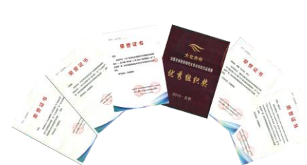
研究生在第一届全国农林院校研究生学术科技作品竞赛获得佳绩

学校研究生教育始终坚持以提高人才培养质量为核心，深化招生体制改革，强化研究生过程管理，不断完善各项培养和管理制度，提高学位授予质量，并取得了明显成效。获国家留学基金委资助项目33项；获“全国优秀博士学位论文提名论文”1篇，江西省优秀博士学位论文13篇，江西省优秀硕士学位论文57篇，江西省研究生创新专项资金项目203项，江西省“青马工程”项目29项；在全国专业学位优秀硕士学位论文评选中，获得2篇全国农业推广硕士专业学位优秀论文，2篇全国兽医硕士专业学位优秀论文，2篇全国林业硕士专业学位优秀论文；有2位研究生荣获“2013年中国大学生自强之星”提名奖和“2013年江西省大学生年度人物”入围奖，1位研究生获“大北农杯”第一届全国农林院校研究生学术科技作品竞赛特等奖，1位毕业研究生荣获首届“中国杰出兽医”称号。研究生服务团队连续13年被评为省级暑期社会实践活动优秀服务营队，2次被评为国家级暑期社会实践活动优秀服务营队。