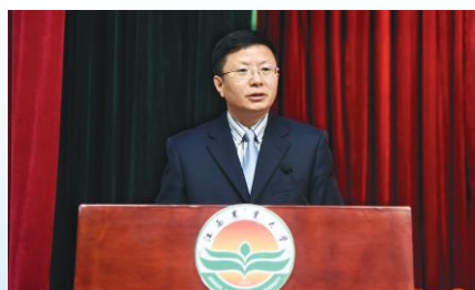
赵小敏校长，教授，博士生导师，享受国务院政府特殊津贴专家、新世纪百千万人才工程、全国模范教师