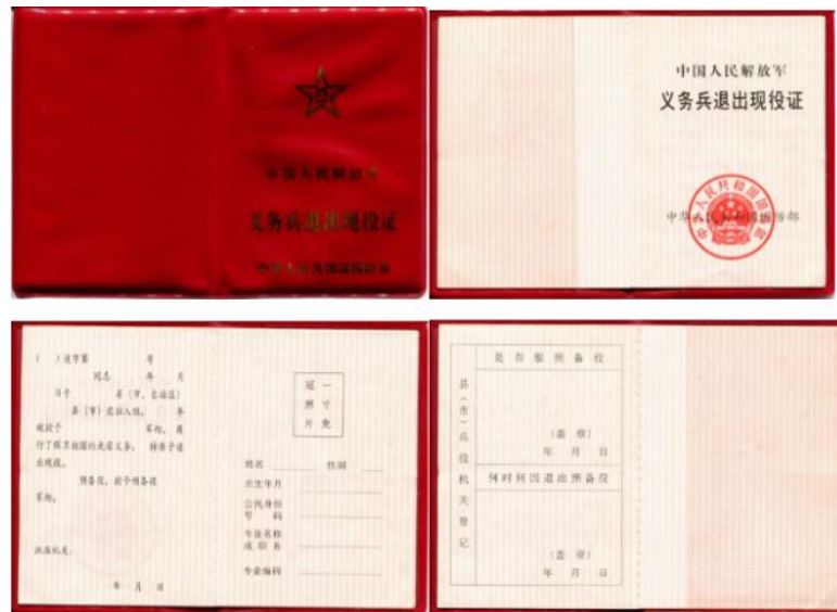
《士官退出现役证》样式：