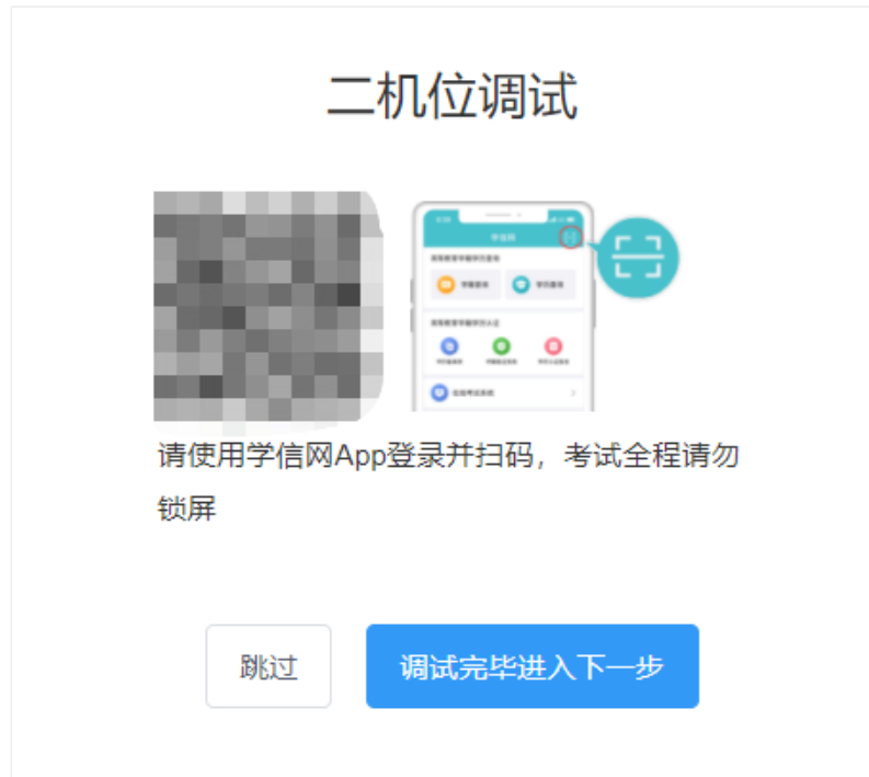
图 6-2 二机位调试二维码