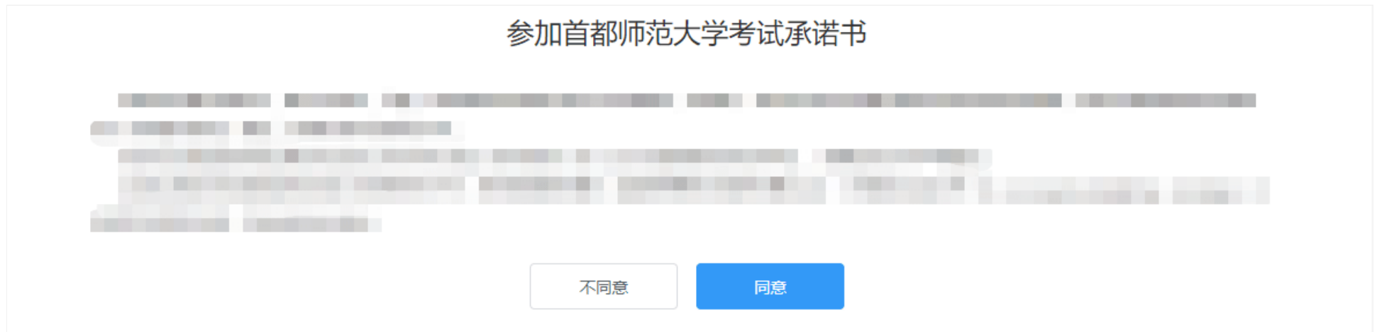
图 5-2 阅读考试承诺书

首次进行资格确认的考生，资格确认后会出现考试单位的考试承诺书，阅读考试承诺书后点击【同意】按钮。