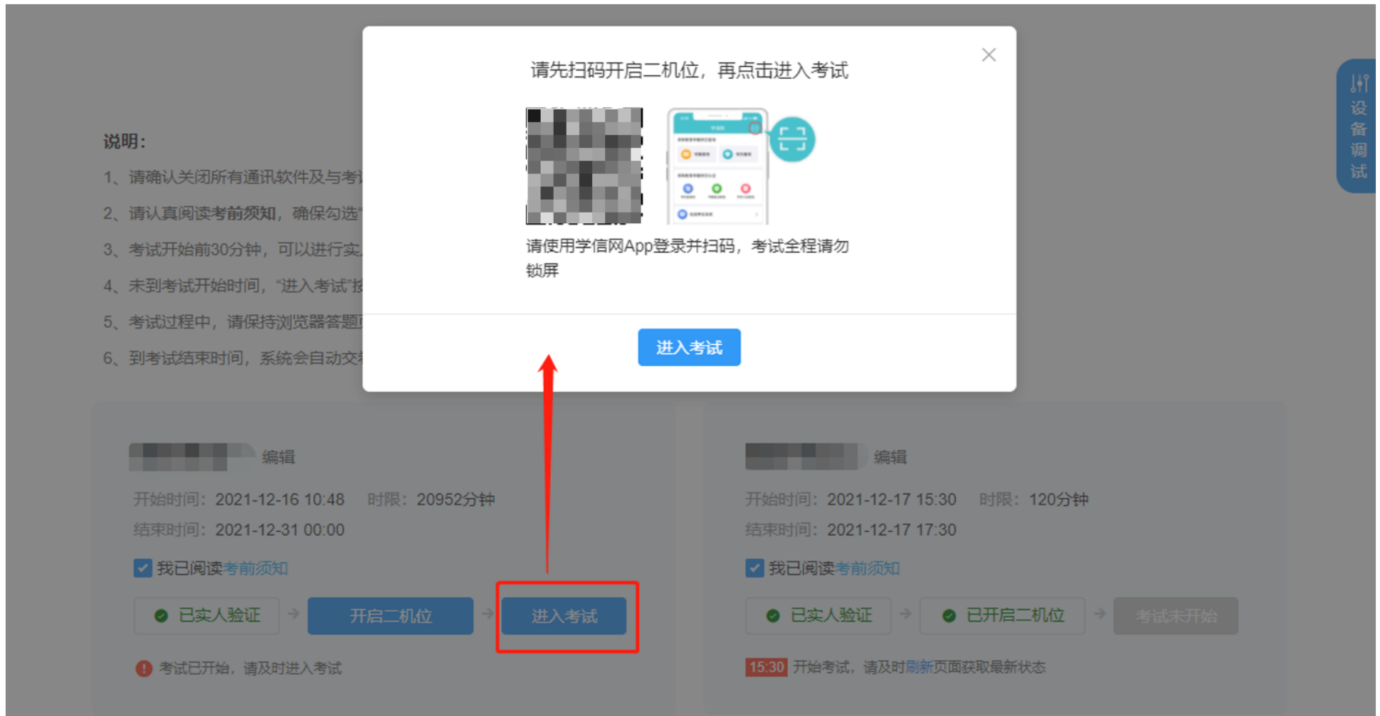
图 7-6 未开启二机位，点击【进入考试】

进入考试后，考试页面的考题内容、考题个数由考试单位设置。页面左上角显示该场考试的考试名称、考题总个数以及当前题目数，右上角显示考试剩余时间和考生一机位、二机位监考视频。