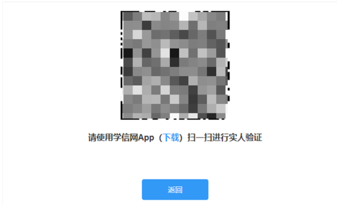
图 3-2 实人验证二维码