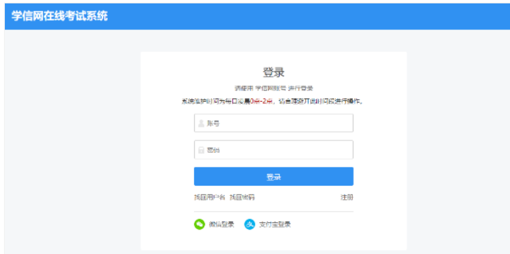
图 2-2 登录