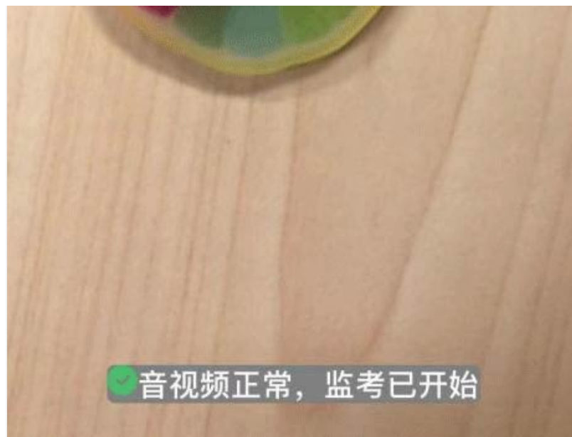
图 7-4 移动端，二机位成功开启