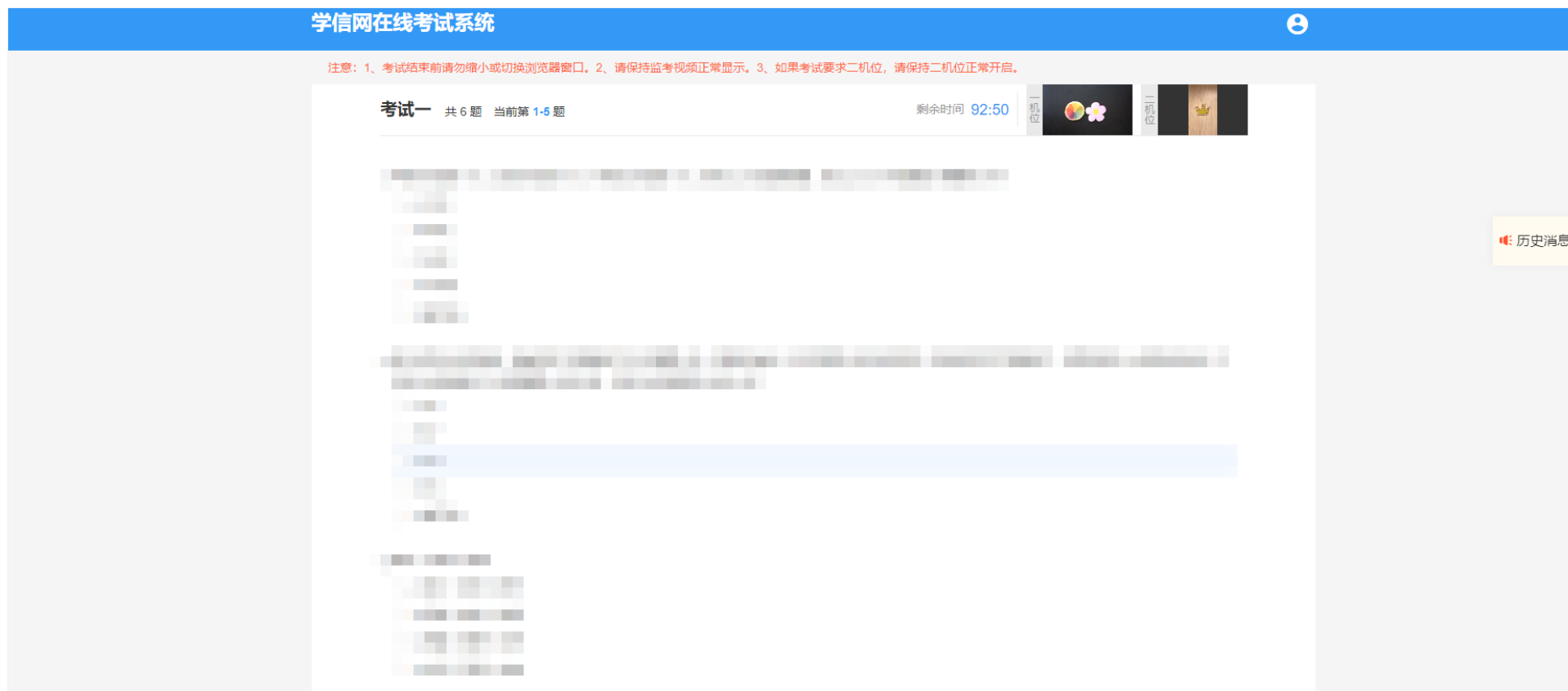
图 7-9 选择题，浏览器全屏显示

(1) 选择题类型，一页显示五道题目，全部答完后可进入下一页，进入下一页后不允许返回修改。