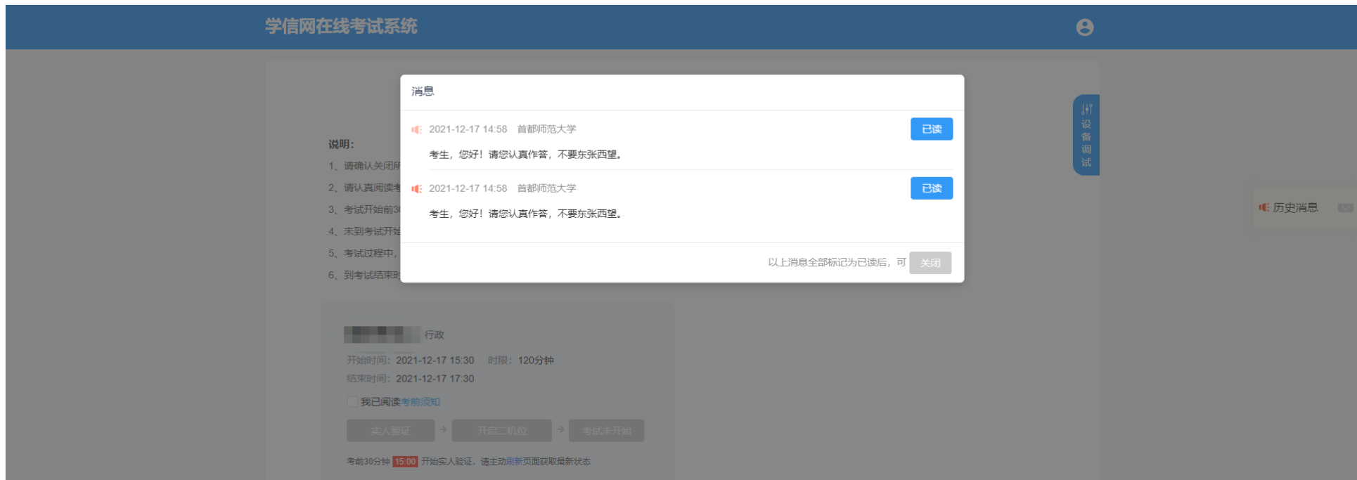
图 7-2 收到消息