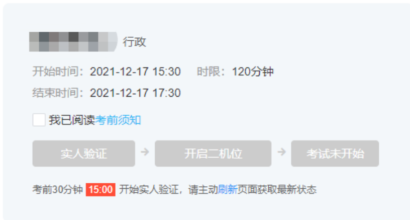
图 7-1 考试信息

考试单位发给考生的消息，会以弹窗形式显示在考试信息和答题页面。所有消息都点击【已读】后，才可关闭消息弹窗。考生可在右侧“历史消息”中查看已读消息。