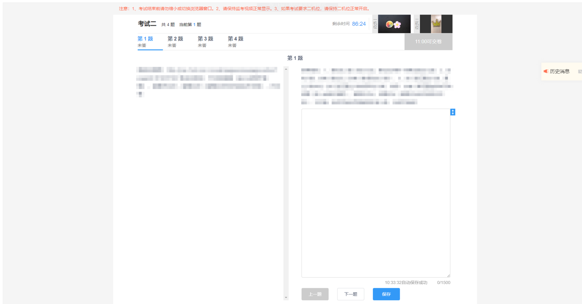
图 7-10 简答题，浏览器全屏显示