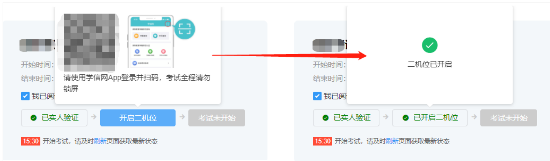
图 7-3 开启二机位