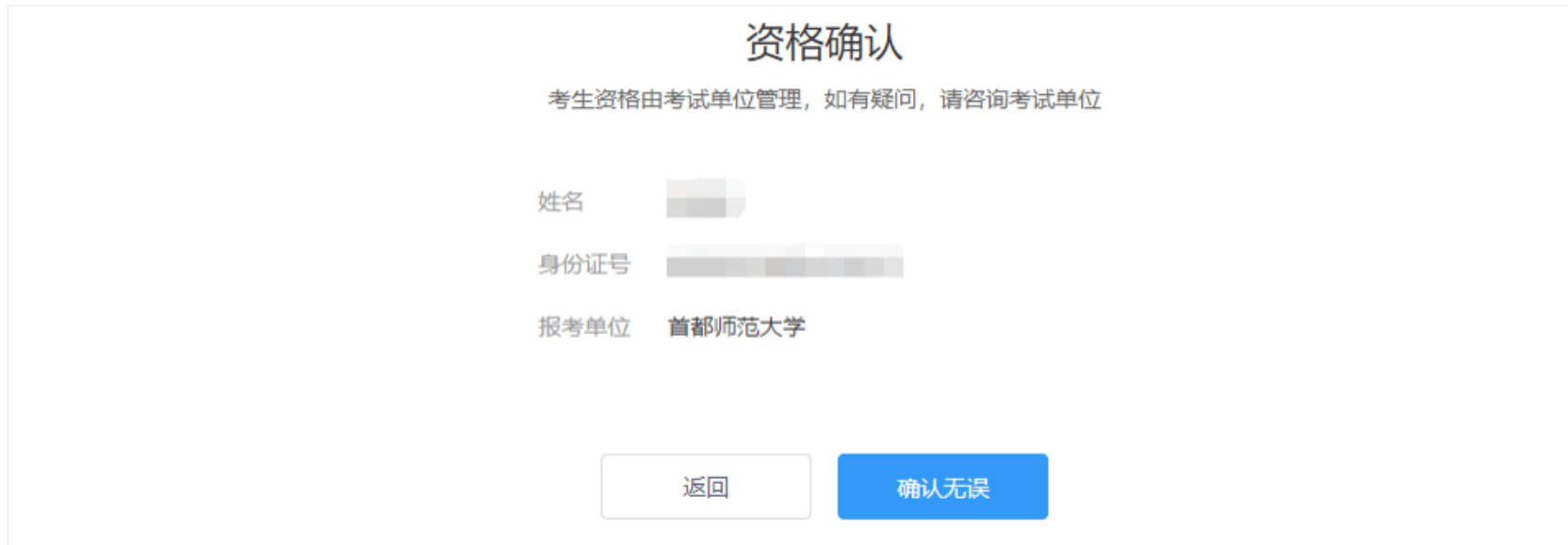
图 5-1 资格确认

首次进行资格确认的考生，资格确认后会出现考试单位的考试承诺书，阅读考试承诺书后点击【同意】按钮。