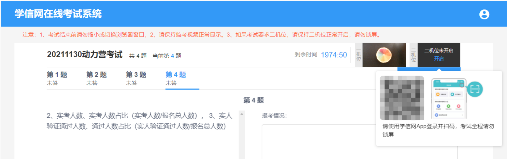
图 7-7 二机位已断开，点击开启，重新扫码

进入考试后，浏览器窗口将会全屏显示，考试结束前请勿缩小或切换窗口，系统将监控并记录。