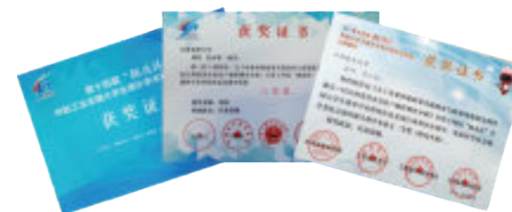
研究生在“挑战杯”全国和省级比赛中获得佳绩