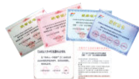
研究生暑期社会实践活动连续获得国家和省级奖励