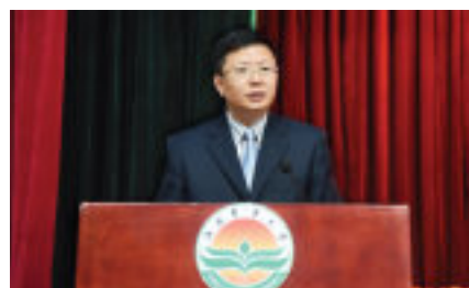
赵小敏校长，教授，博士生导师，享受国务院政府特殊津贴专家、新世纪百千万人才工程、全国模范教师